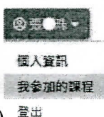
(圖 1) 登入資訊

(一)查詢已報名課程：會員登入平台後於首頁右上方，點選「個人姓名」之「我參加的課程」(如下圖 1)，再選取課程查閱。以手機/平板裝置進入該課程頁面，點選網頁左上方三條橫槓圖示(如下圖 2)可查閱課程。